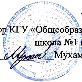
График питания на 2024-2025 учебный год